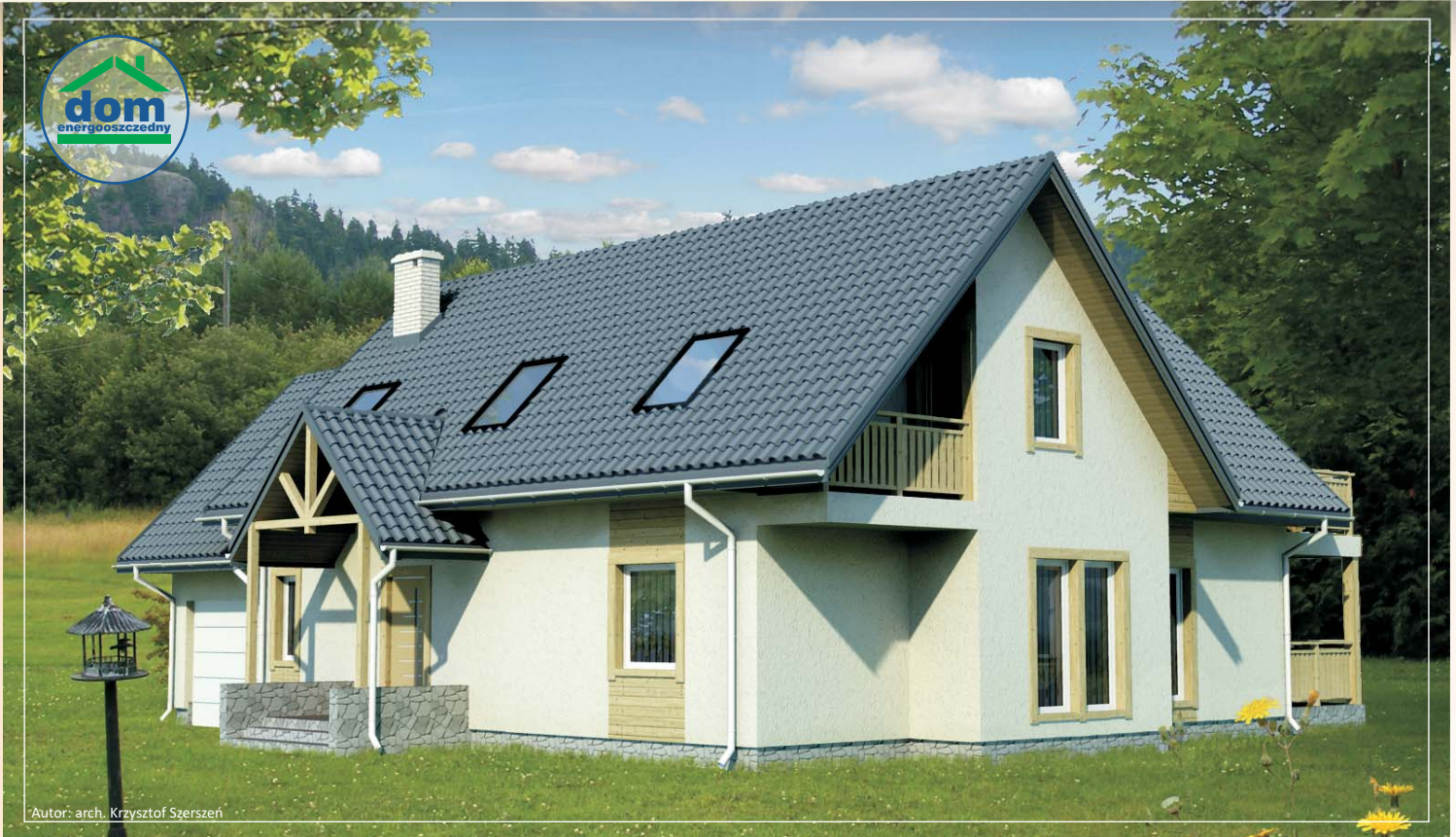
Autor: arch. Krzysztof Szerszeń