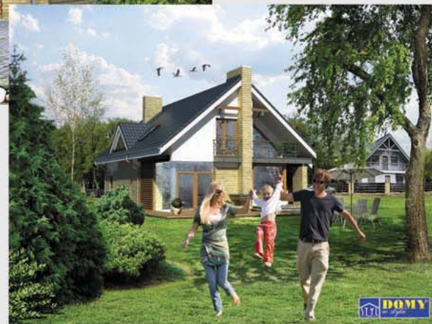
Autor: arch. Maciej Matłowski